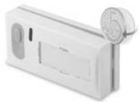
Obr 1. Otvírání