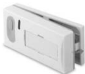
Obr 2. Zavírání